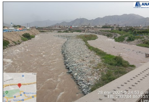
ZONA COLMATADA DEL RIO RIMAC